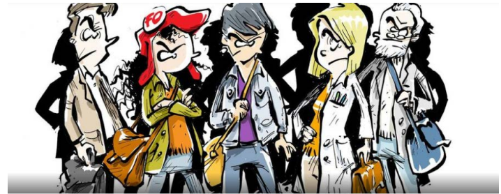
Professeurs des écoles publiques de Mayenne Groupe Privé · 188 membres

Quant aux demandes des services extérieurs (CMP, médecin traitant, neuropédiatre, pédopsychiatre...), un rappel devrait être adressé aux DASEN pour soutenir les PsyEN EDA face à ces injonctions.